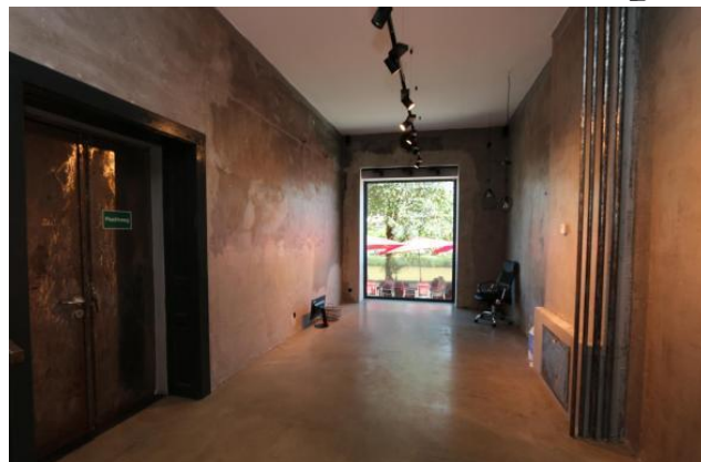
EG Drau Seite