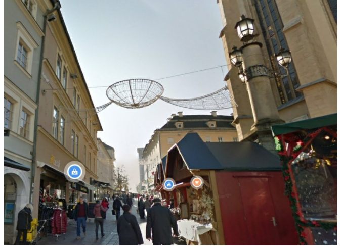
Lage am Hauptplatz

WIR FREUEN UNS AUF IHRE TERMINVEREINBARUNG: +43 (0) 42 42 - 24 2 64